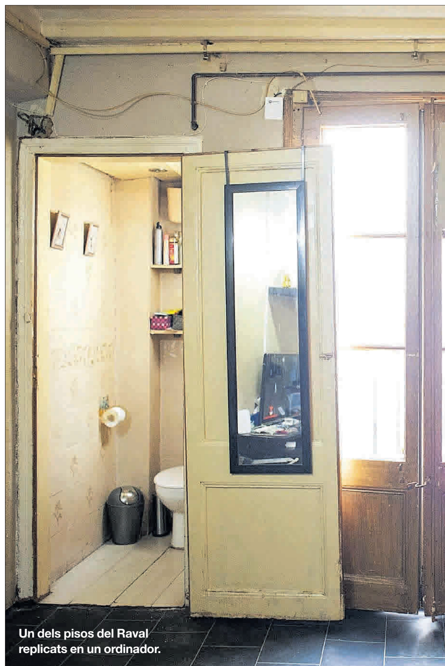
Un dels pisos del Raval replicats en un ordinador.

A partir d'ara, Oasi Urbà pretén «comprovar i optimitzar al