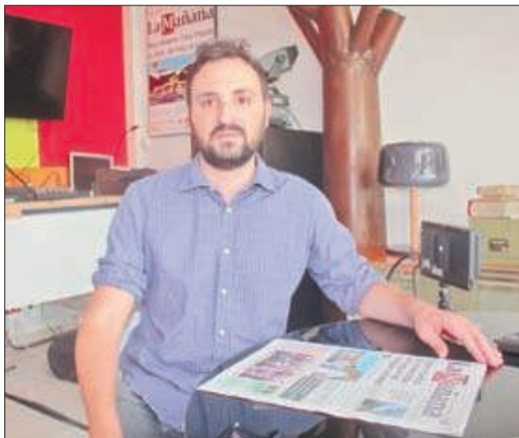
'Cinematic Radio' és el segon disc de Capdevila

"Tinc moltes ganes que la gent de Lleida conegui la meua música. Aquí vaig presentar el meu primer disc i la veritat és que en guardo un molt bon record i vaig quedar molt content", explica Capdevila. Sobre les nou com-