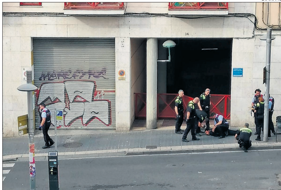
L'home, estirat a terra, va ser detingut pels agents dels cossos policials que hi van intervenir.

De moment, no ha transcendit el motiu per al qual l'home va intentar desfer-se del ganivet. Les forces de seguretat van iniciar una investigació per conèixer en