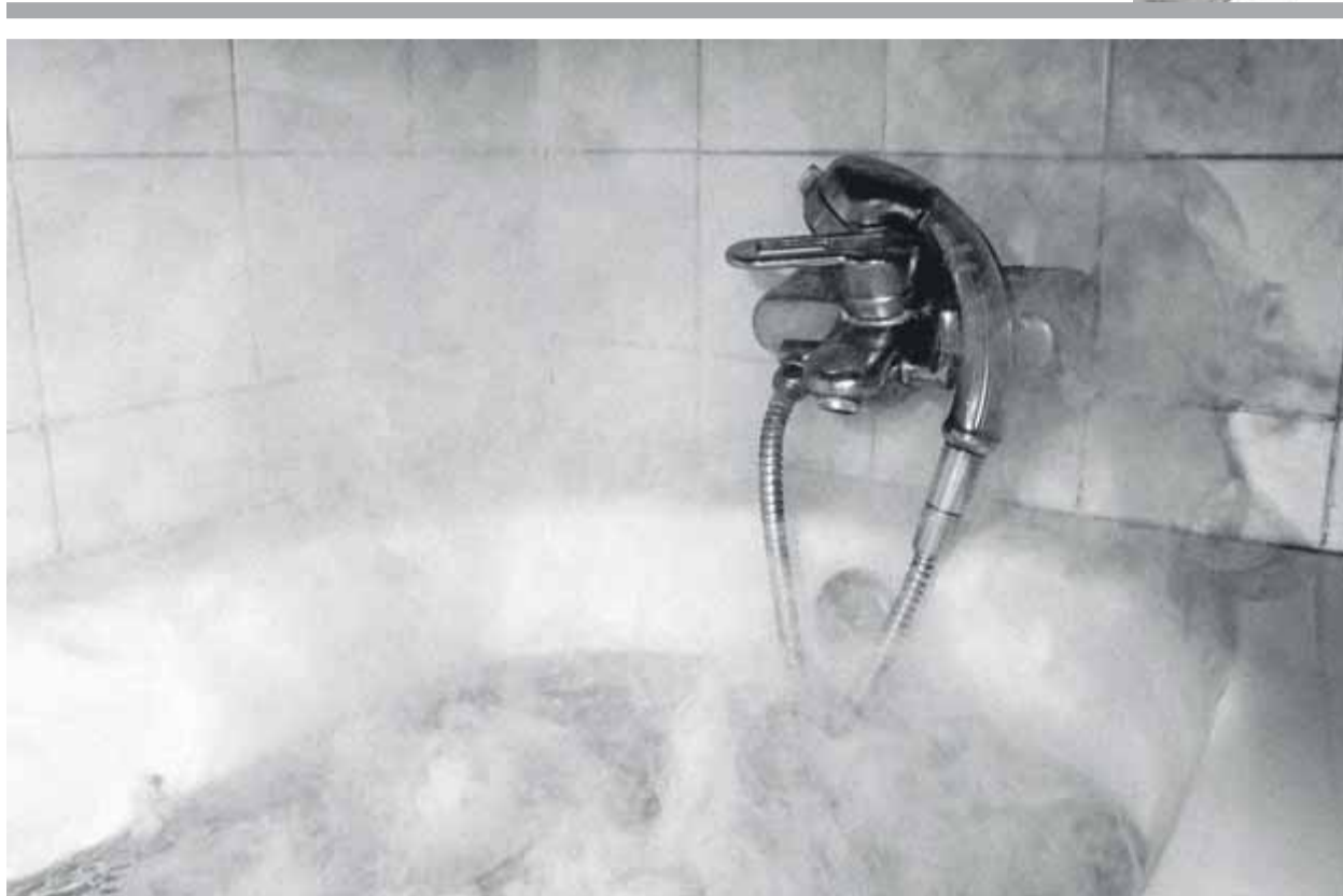
'Bany d'aigua bullent', de la sèrie 'On abortion' ■ LAIA ABRIL

"Pericas era en aquell moment l'avantguarda de