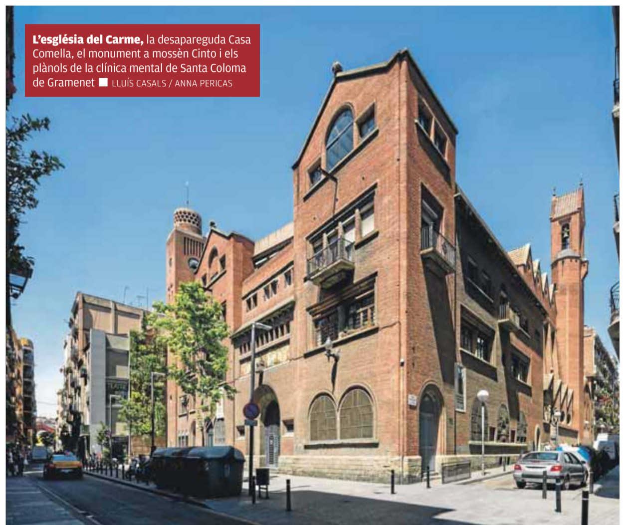
L'església del Carme, la desapareguda Casa Comella, el monument a mossèn Cinto i els plànols de la clínica mental de Santa Coloma de Gramenet ■ LLUÍS CASALS / ANNA PERICAS

La Secesió Vienesa va ser el seu model per crear un estil que fon tradició i modernitat. Poua del romànic, però Catasús remarca: "No fa neoromànic perquè no el copia: el reinterpreta." Pericas va ser un gran estudiós de l'art associat amb els orígens