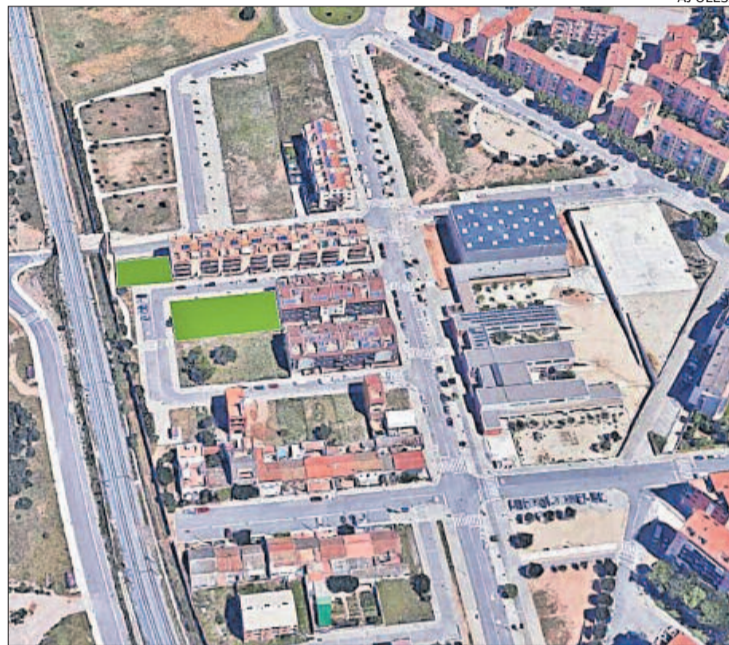
Espai on s'han de fer els tres blocs de pisos a Olesa

per aconseguir que Olesa de Montserrat hagi entrat en aquesta tercera convocatòria del Programa de lloguer assequible ha estat cabdal l'al·legació presentada per