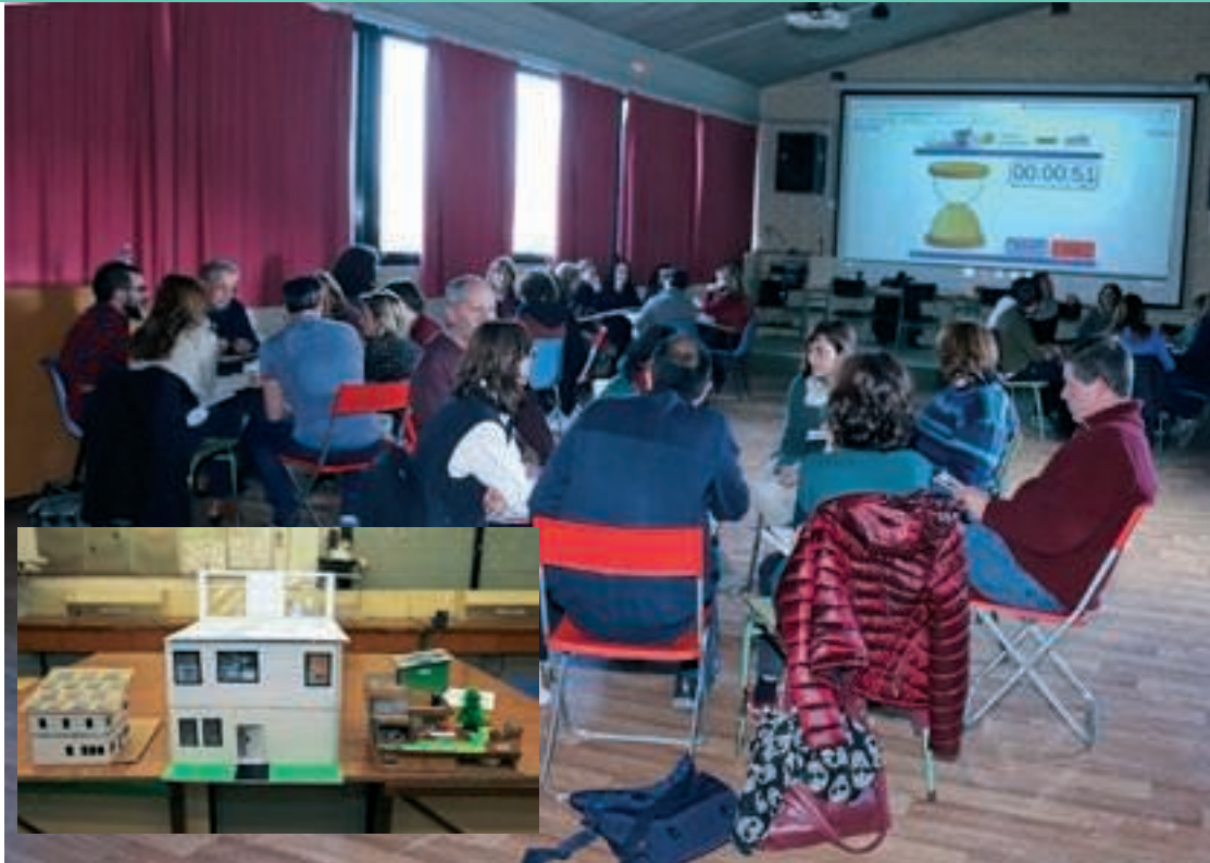
Els professors de l'institut Pere Barnils, reunits per tractar el projecte Magnet. A la foto petita, algunes maquetes

L'institut Pere Barnils de Centelles és un dels centres on es fa aquest pla pilot i en aquest cas té com a padrins del projecte el COAC i l'Espai Cerdà, casa natal del centellenc il·lustre i urbanista, on es recull una part de la seva obra i vida. Aquests padrins assessoren el centre educatiu en els tres anys que dura el projecte. Es proposen diferents dinàmiques i tallers com repensar espais del mateix centre, fer una anàlisi urbanística de